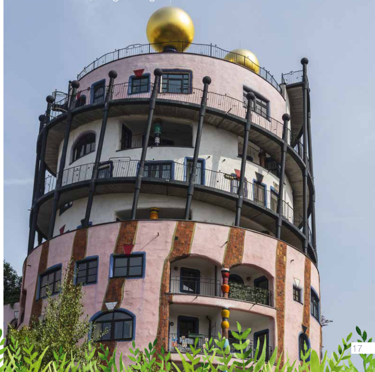
Grüne Zitadelle, Magdeburg

Der Preis ist abhängig von der tagesaktuellen Übernachtungsrate. Beherbergungssteuer der Stadt Königswinter vor Ort zahlbar.