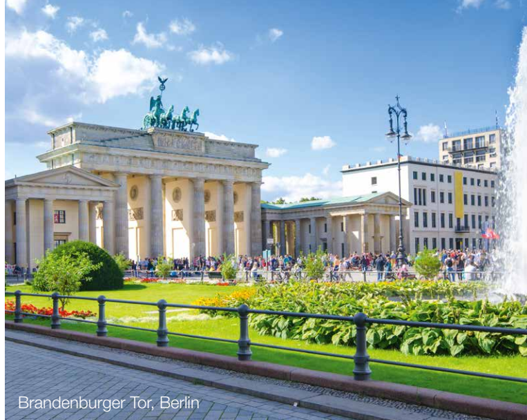
Brandenburger Tor, Berlin