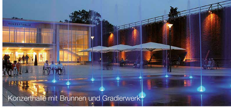
Konzerthalle mit Brunnen und Gradierwerk

Vorausbuchungsfrist drei Tage. Kurtaxe vor Ort zahlbar.